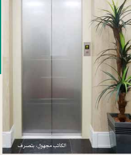
الكاتب مجهول، يتصرف

تعودت الثرثرة دون ان أبالي، وكنت أجد المتعة في الحديث عن الآخرين في غيابهم، لكن تغير كل ذلك في أحد الأيام حينما كنت في مصعد.